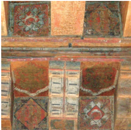
Escudo de la Casa de Aragón

Ahora te encuentras en una sala que hace 600 años fue parte de un gran salón del Palacio Arzobispal. Aquí estuvieron reyes y arzobispos, y celebraron grandes festejos. El techo de madera y su policromía , son originales de esa época. Incluso podemos ver los escudos de los dos mecenas que encargaron la ampliación del palacio en el siglo XIV: el arzobispo Don Lope Fernández de Luna y el rey Pedro IV el Ceremonioso .