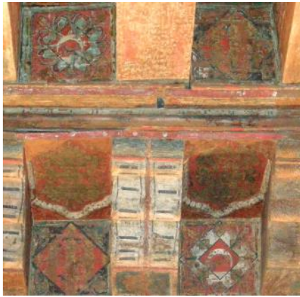
Escudo de la Casa de Aragón

Ahora te encuentras en una sala que hace 600 años fue parte de un gran salón del Palacio Arzobispal. Aquí estuvieron reyes y arzobispos, y celebraron grandes festejos. El techo de madera y su policromía , son originales de esa época. Incluso podemos ver los escudos de los dos mecenas que encargaron la ampliación del palacio en el siglo XIV: el arzobispo Don Lope Fernández de Luna y el rey Pedro IV el Ceremonioso .