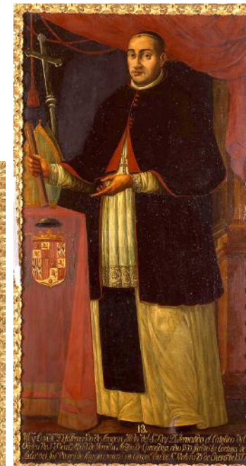
Arzobispo don Hernando de Aragón