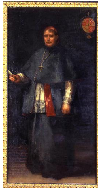
Arzobispo don Joaquín Company

Acabas de entrar en el Salón del Trono del Palacio Arzobispal . En este espacio se celebran desde el siglo XVI recepciones importantes . Ahora es también parte del museo, y así podemos ver una galería de retratos de los arzobispos de Zaragoza. Todos ellos han sido pintados por artistas importantes. Destaca sobre todo uno de ellos: Francisco de Goya . ¿Te suena? Hemos conocido algunos de sus cuadros en la sala anterior. Tu misión en esta sala es descubrir dónde se ubican los siguientes retratos: