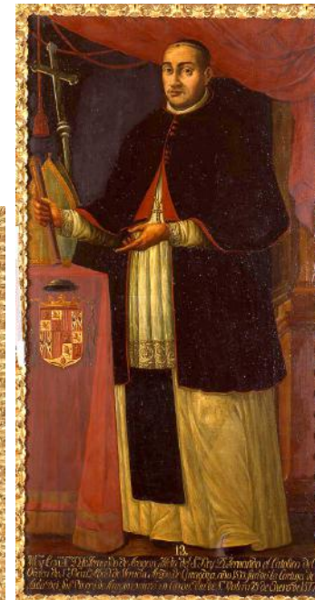
Arzobispo don Hernando de Aragón